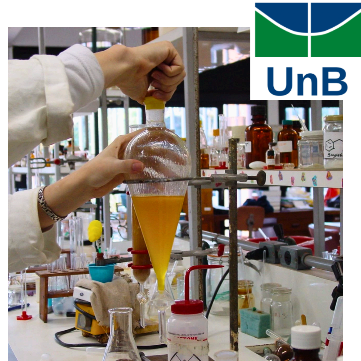
Laboratório de Química da Universidade de Brasília: Foto: Daiane Souza/Secom/UnB)

Crédito de Carbono: Estudos avançados sobre a mitigação das emissões, destravando novos potenciais financeiros.